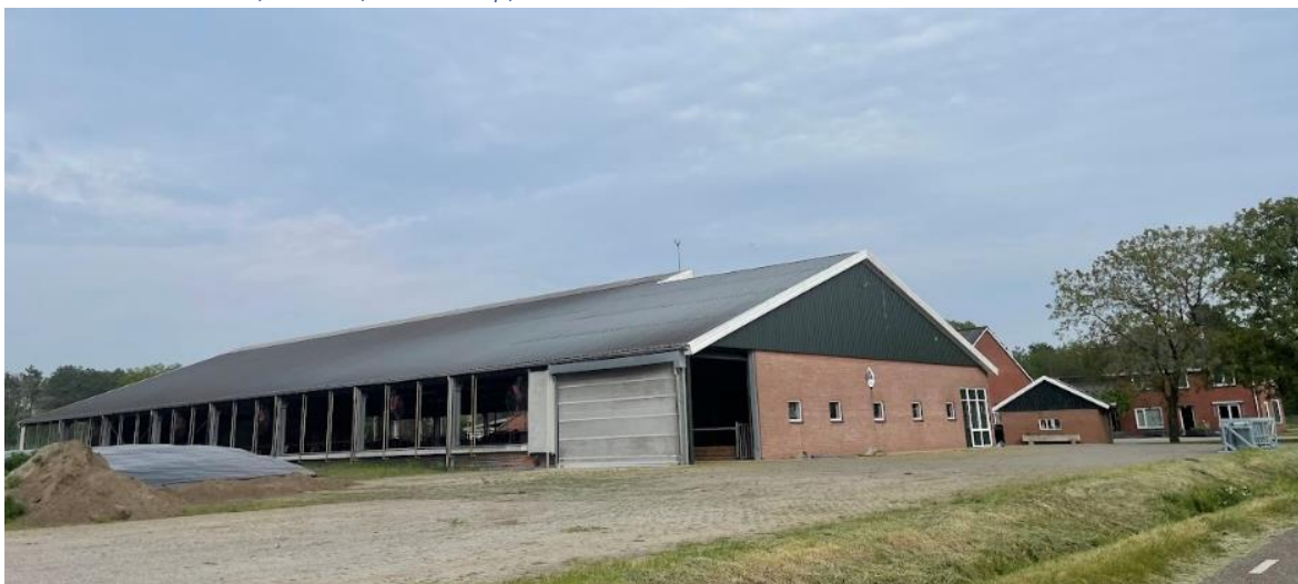
Figuur 1 Melkveehouderij in de Broekheurne