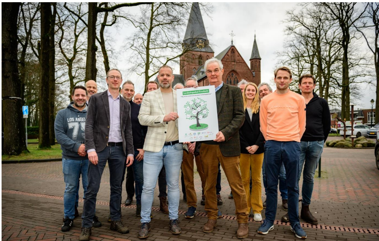
Figuur 1

ENSCHEDÉ - De 'Landschapsdeal Enschede' is een feit. Afgelopen woensdag werd de overeenkomst ondertekend door meerdere partijen waaronder de gemeente. Het doel is om de samenwerking op het gebied van streekeigen landschapsbeheer te bekrachtigen. Op de vraag 'waarom niet eerder?' antwoordt Fraukje Roeleveld van Stawel van 'goeie vraag'.